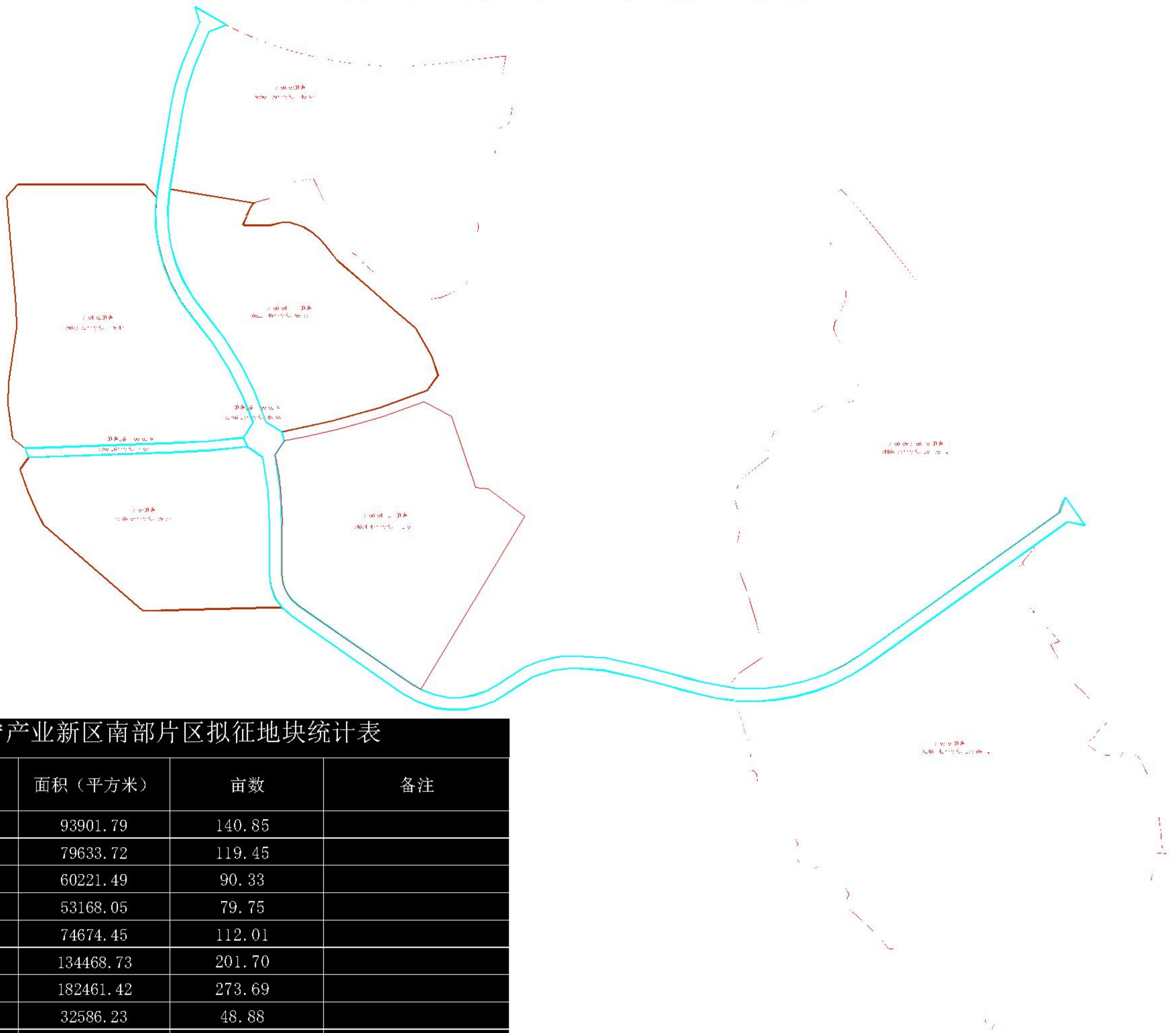
万宁产业新区南部片区拟征地块统计表